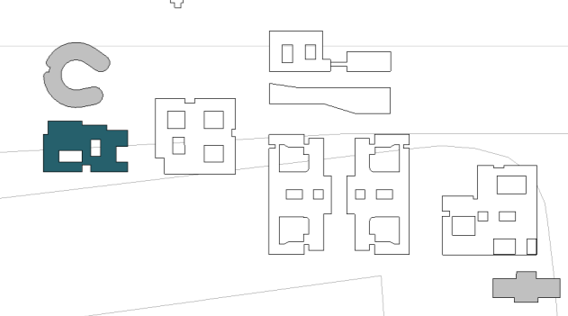
Plan de situation PEDOPSYCHIATRIE